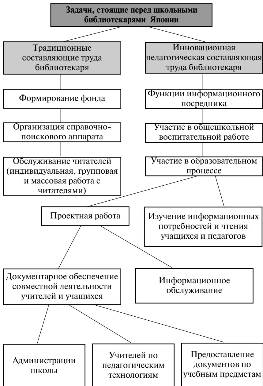
Схема 1. Задачи школьных библиотекарей Японии

невной работе. Эта функция носит временный характер, пока компьютеры не при- вились в педагогических коллективах достаточно прочно;